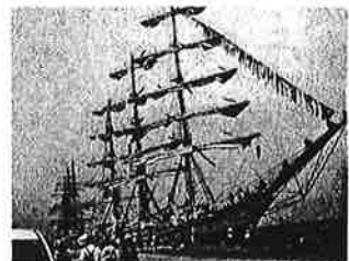
復元された旗艦「ミシシッピ」浦賀沖港にて

嘉永6年に起きたペリー、プチャーチンの来航と二宮尊徳の日光「御神領仕法」は、実に不思議な糸で結ばれていたのである。